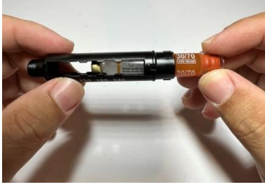
นำอินซูลินใส่หลอดบรรจุ